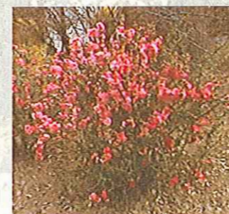
Cognassier du Japon