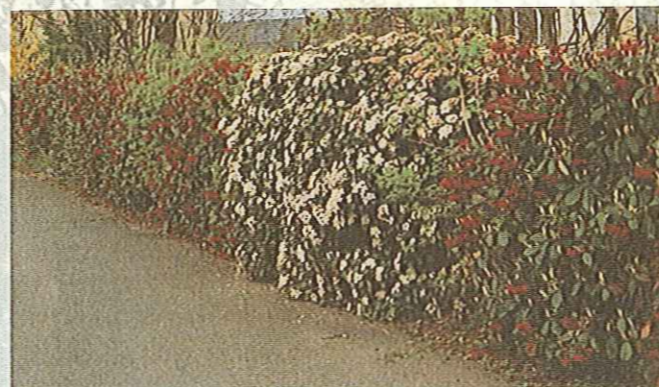
Exemple de haie variée composée d'essences locales

PARCE QUE , la haie variée se garnit mieux et plus vite. De plus, elle nécessite moins d'entretien.