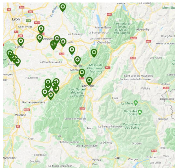
Carte : Nids de frelon asiatique détruits sur le département de l'Isère en 2019

Les conditions climatiques de l'année semblent avoir été défavorables au prédateur. Malgré tout, le frelon asiatique continue sa progression.