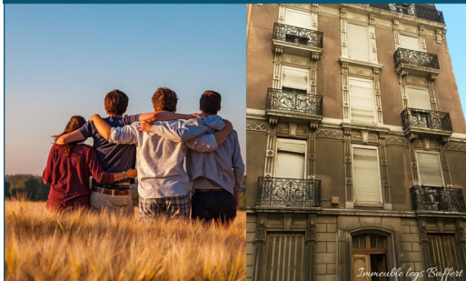
Immobilier legs Baffert

Plus que quelques jours pour déposer votre candidature en mairie !